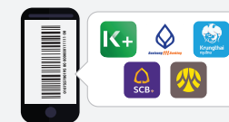
โมบายแบงก์กิ้ง เฉพาะธนาคารเปิดให้บริการ

ข้อควรระวัง การชำระค่างวด ต้องขอรับใบเสร็จ/หลักฐานการชำระจากผู้รับชำระและเก็บไว้เป็นหลักฐานทุกครั้ง