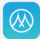
เมืองไทย แคปปิตอล แอปพลิเคชัน

A : ลูกค้าสามารถชำระค่างวดได้ที่สาขาของบริษัททุกสาขา หรือขอรับบาร์โค้ด จากทุกสาขาของบริษัท เพื่อนำไปชำระค่างวดผ่านตัวแทน เช่น